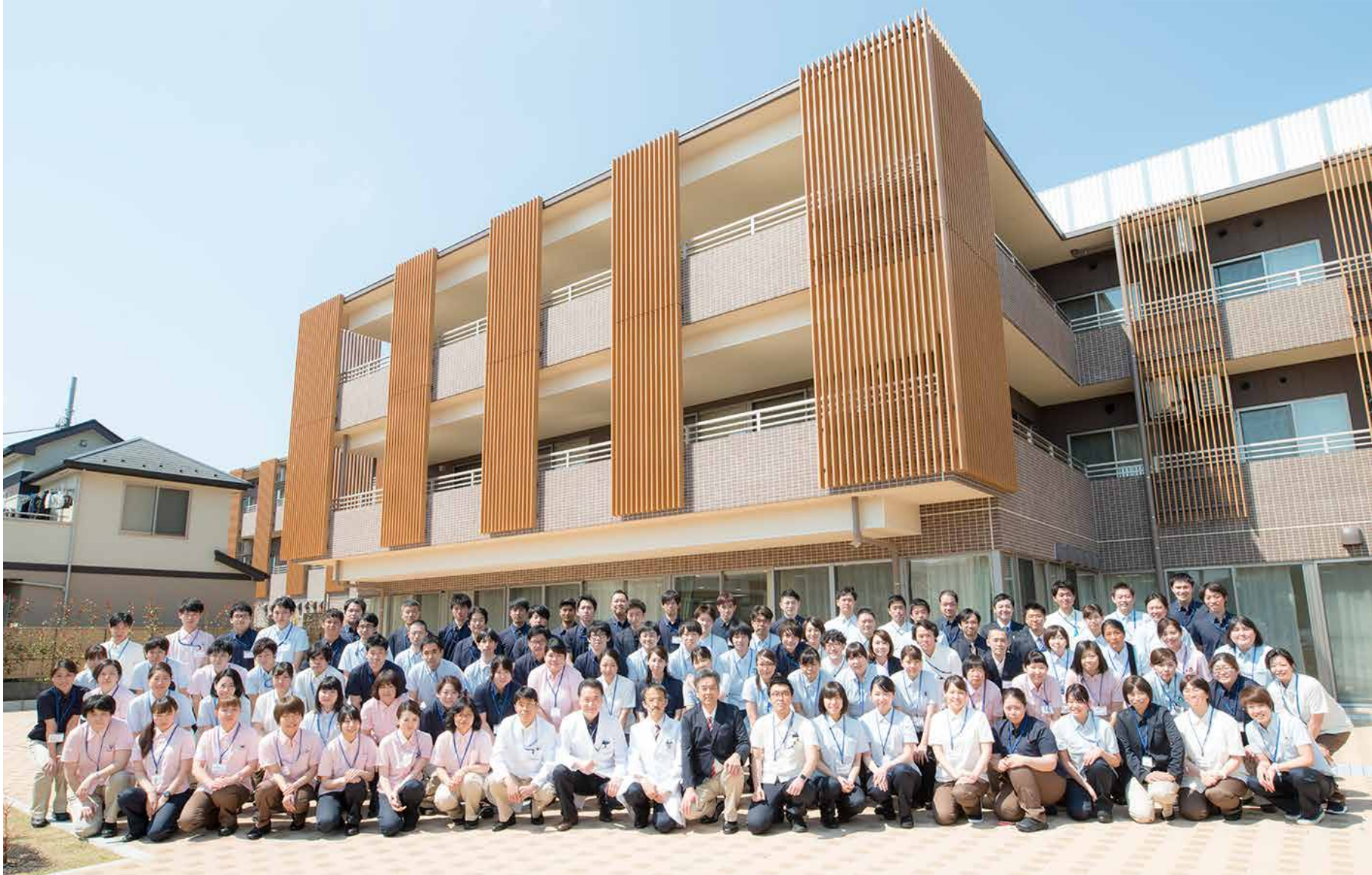
4月3日 ねりま健育会病院・ライフサポートねりま 入社式

今年度は、4月1日に開院した東京都練馬区大泉学園の「ねりま健育会病院・介護老人保健施設ライフサポートねりま」、そして秋に開院予定の神奈川県藤沢市の「湘南慶育病院」がグループの仲間に加わります。私はこの2つの新しい病院・施設は、将来必ずや健育会グループを牽引する存在になっていくと確信しています。しかし、新しい病院・施設が地域に根ざし、経営を軌道に乗せていくためには時間が必要です。