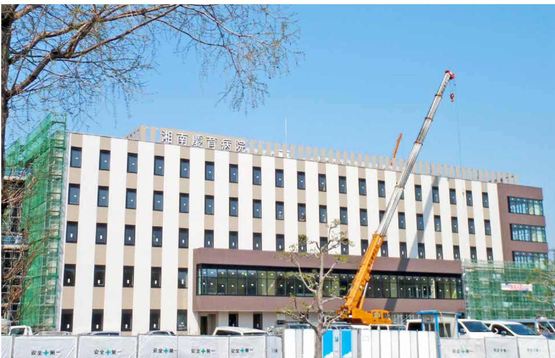
4月14日 着々と工事が進む湘南慶育病院（外観）

そのような中、健育会グループの既存病院・施設で働く職員の皆さんが高い使命感を持って、「運営方針のヒアリング」で確認した「理念達成時の姿」「1年後の姿」を現実のものとするために行動し、予算を確実に達成していくことが、間接的にはありますが新しい病院・施設をサポートすることにも繋がります。